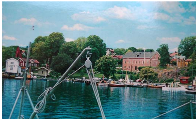
Vykort från Tullmuseet

1928, då den fasta tullanstalten Dalarö drogs in som en av de sista av tullstationerna försökte Tullstyrelsen att avyttra huset eftersom underhållskostnaden ansågs hög för ett hus som inte längre behövdes. Det fanns inga intressenter som ville ta över huset. Detta berodde bl.a. på att Dalarö samhälle som i slutet av 1800-talet och början av 1900-talet varit en klassisk badort inte längre fyllde Stockholmarnas behov som rekreationsort.