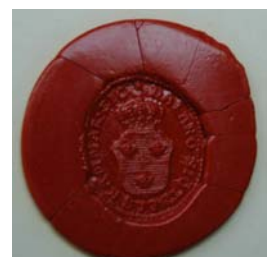
Sigillet på broschyren

Under ett antal år fanns Tullmuseet med omfattande utställningar, lager och administrationslokaler i huset. Bostadsutrymmen nyttjades av Dalarö kustpostering under Östra kustdistriktet.