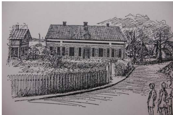
Teckning av Majmo Montan

I tullhuset finns nu två rum inredda som Dalarö Skärgårdsmuseum. Dalarö Turistbyrå nyttjar en del av byggnaden och i övrigt hyrs den ut för olika ändamål, utställningar, sammanträden, möten, fester mm.