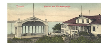
Dalarö Hotell Sommarhotellet