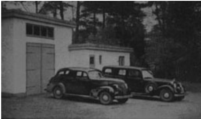
Foto troligen taget 1947 utanför brandstationen på Sveavägen. Här står två av bilarna, Chevrolet 1939 och Horch 1936.