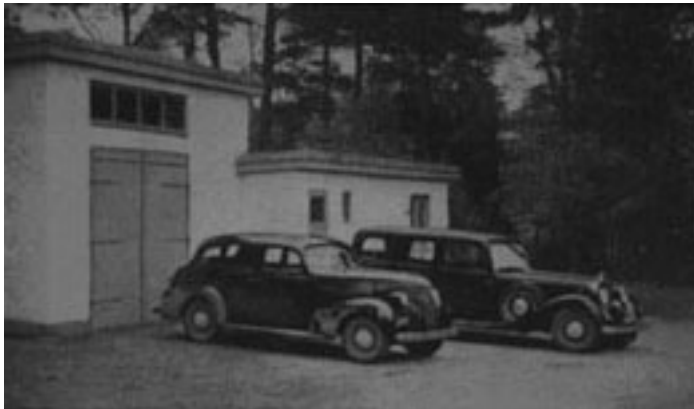
Foto troligen taget 1947 utanför brandstationen på Sveavägen. Här står två av bilarna, Chevrolet 1939 och Horch 1936.