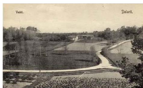
Foto från början av 1900-talet.

Innan Dalarö kanalen och Kanalbron byggdes tog man sig mellan landmassorna genom att vada över i det grunda vattnet, härav dagens namn "Vadet" som huset till vänster på bilden benämns.